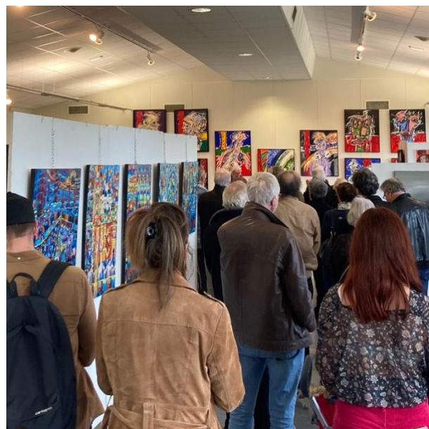
Vernissage du 35ème Salon de peinture et de sculpture

Le vernissage aura lieu le 16 mars à 17H30 , c'est toujours un moment convivial et d'échanges.