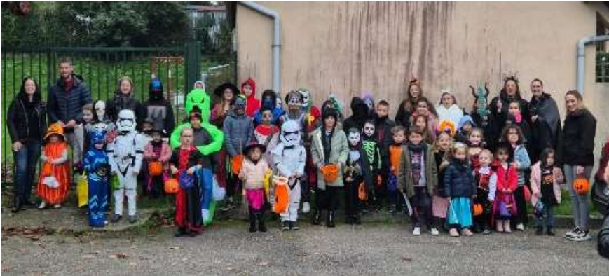
Halloween à Bourg Beaudouin