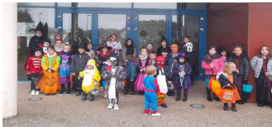
Halloween à Vandrimare