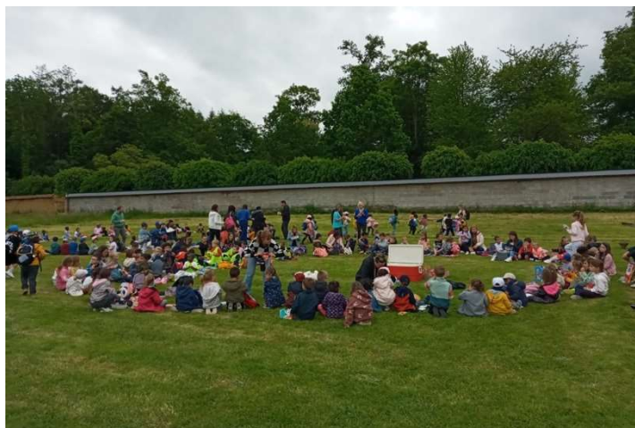
Pique-nique géant Vandrimarais/Versaillais