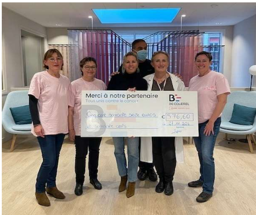
Octobre Rose : remise du chèque par les responsables du FLEP dans les locaux du Centre Becquerel