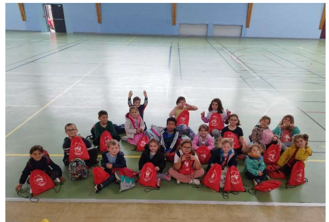
Journée « le Sport Ma Santé » Mercredi 29 mai à Romilly sur Andelle