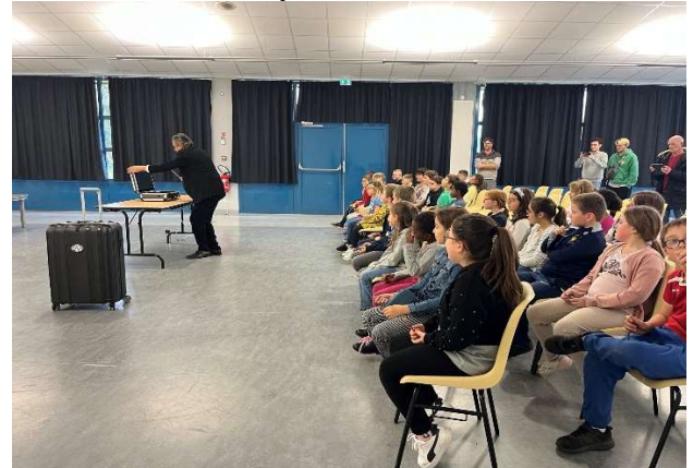
Journée « Sensibilisation au Harcèlement Scolaire » Mercredi 6 novembre en partenariat avec le CDCLA et les centres de loisirs du territoire. Au programme : Course d'orientation, spectacle et divers ateliers.