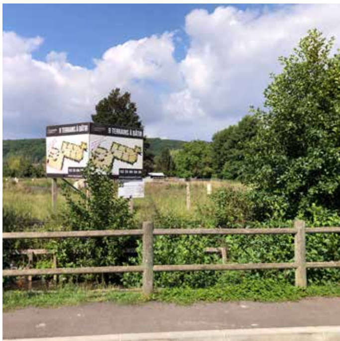
Lotissement Clos des cateliers