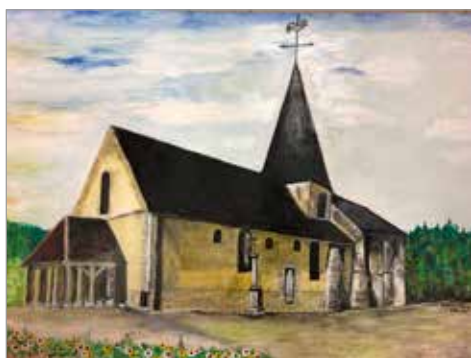
Maurice HOVRAY L'église de Romilly