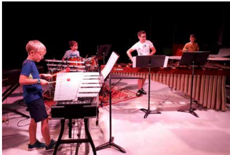
Concert de fin d'année

Vous pouvez flasher ce QR code pour accéder au site de l'École de Musique qui décrit bien toutes les activités proposées ou taper :