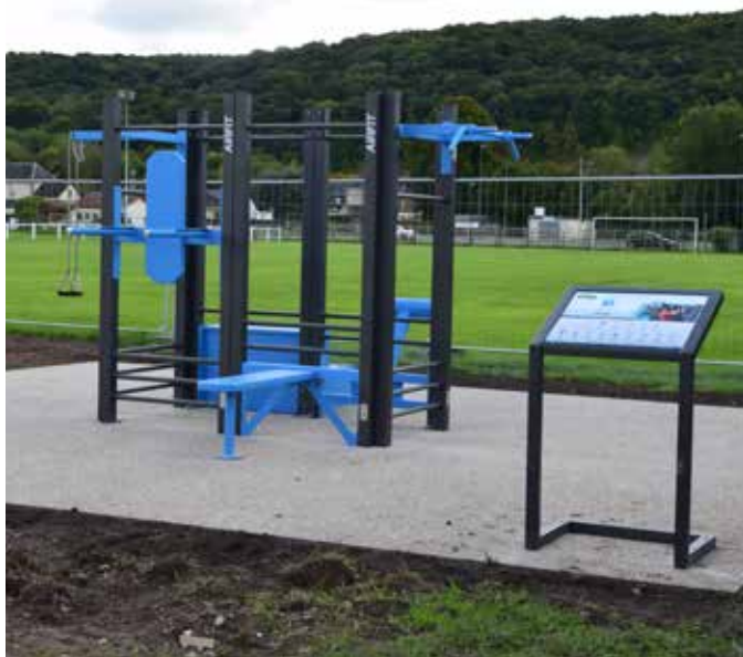
Espace de détente intergénérationnel

Nous avons réalisé un espace de détente intergénérationnel qui s'intègre dans l'ensemble des équipements de loisirs (stade de football, skate Park, aire de jeux. city stade).