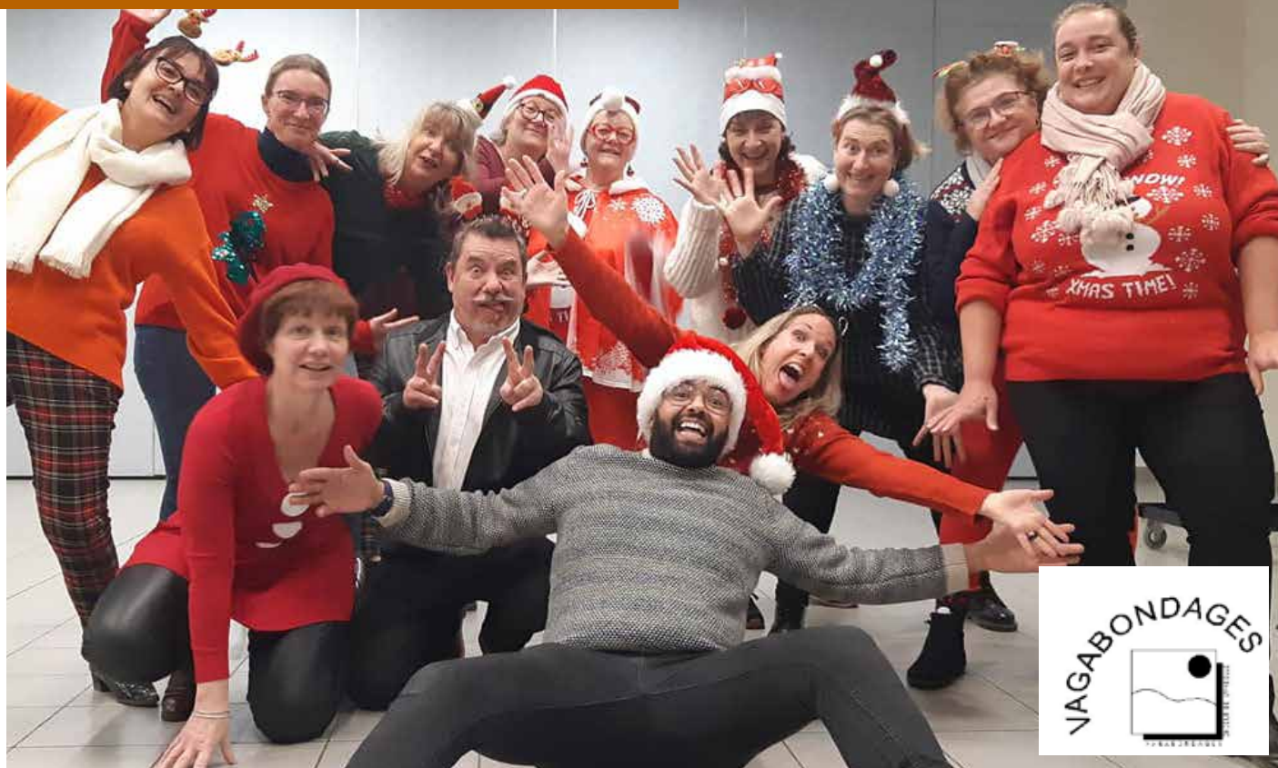
Les membres de l'association