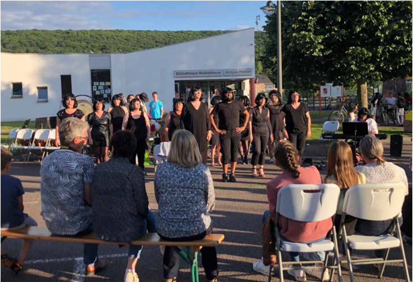
Spectacle à Romilly des Arts

Et maintenant, me direz-vous ? Le travail continue pour finaliser le spectacle qui nécessite d'être adapté à la nouvelle configuration du groupe. L'objectif est de pouvoir proposer quelque chose d'abouti pour le concert programmé le 14 avril 2023 au Complexe Louis ARAGON de Romilly sur Andelle ! Notez bien dans vos agendas et n'hésitez pas à en parler autour de vous ! Nous serons ravis de retrouver le public romillois à cette occasion. Donc hop ! Prenez votre plus beau stylo et notez le vendredi 14 avril 2023.