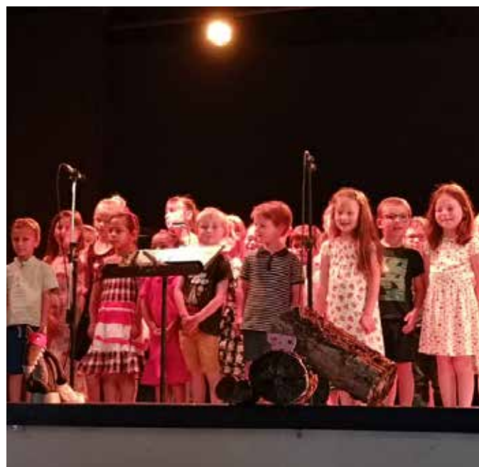
Conte musical des 3 petits cochons