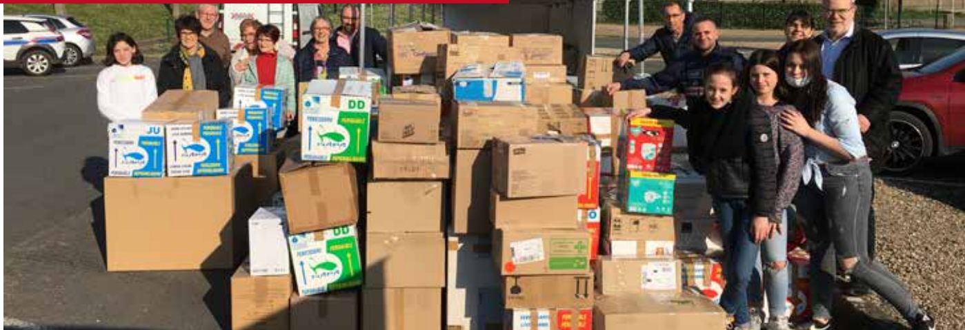
Collecte pour l'Ukraine