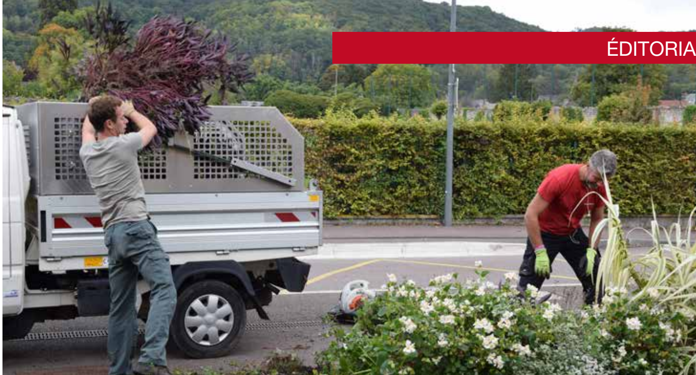
Gestion des massifs

Le prix de l'eau reste élevé à Romilly, cependant, nous avons réussi à négocier en 2011 une première fois un prix plus intéressant du fait de l'augmentation de la population.