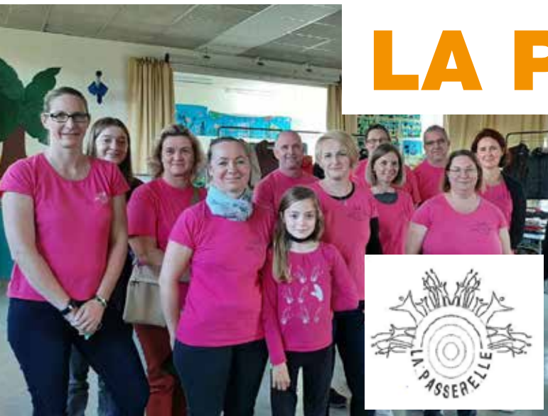
Membres de l'association

Depuis plus de 20 ans, la Passerelle organise des actions dont le but est de reverser les bénéfices aux écoles pour les soutenir dans leurs projets et leurs sorties pédagogiques.