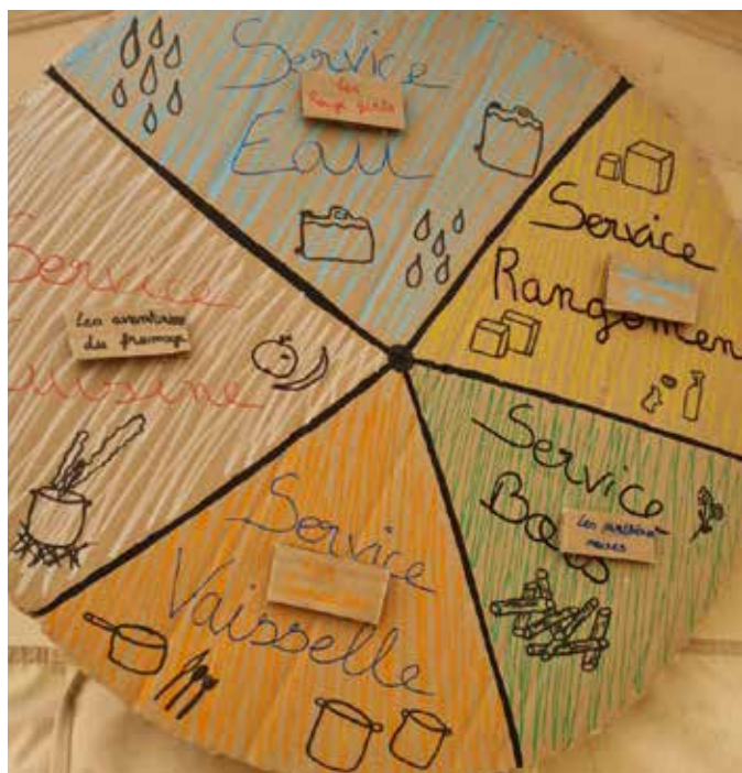
La roue des services