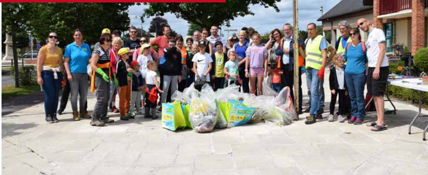
Nettoyage de la commune

du syndicat SIEGE ne sont pas suffisantes pour les 10 prochaines années pour une subvention maximum.