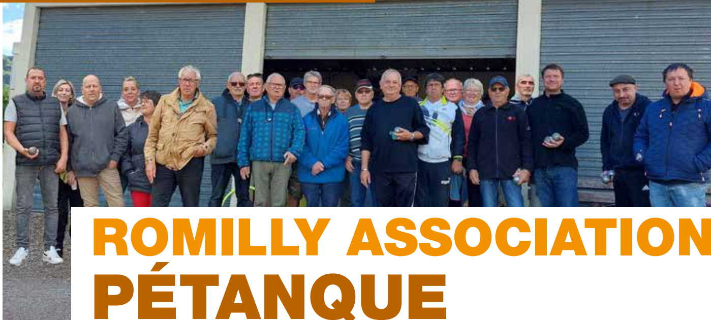
Photo de groupe