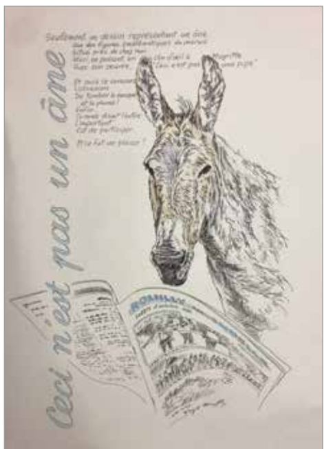
Régis BOUFFAY - Le Marais