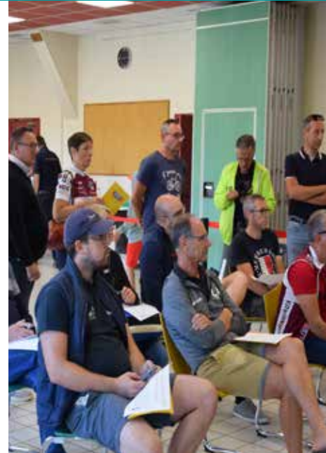
Briefing Salle du CARRE

Dimanche 28 août 2022 s'est déroulée la 75 ème édition cycliste ROUEN-GISORS avec la participation de 71 coureurs pour une distance de 113 km.