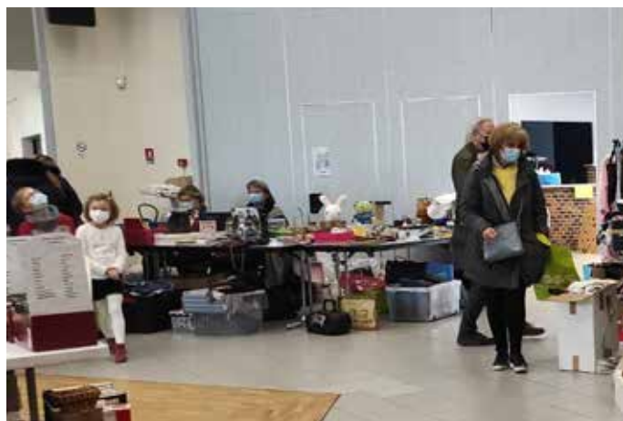
Foire à tout

- Le Romilly des arts, en juin, est toujours un moment de convivialité et de partage où nous avons plaisir à vous rencontrer.