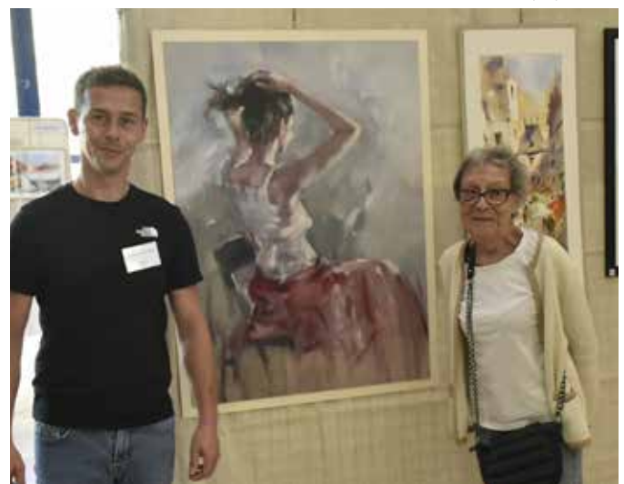
Expo peinture les artistes