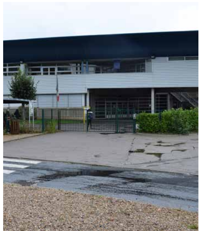
Façade du collège.

Principal du Collège de la Côte des Deux Amants