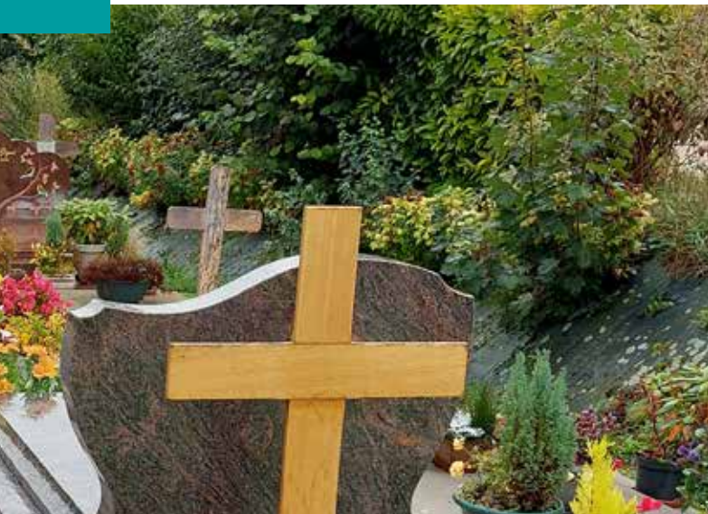
Cimetière - les concessions