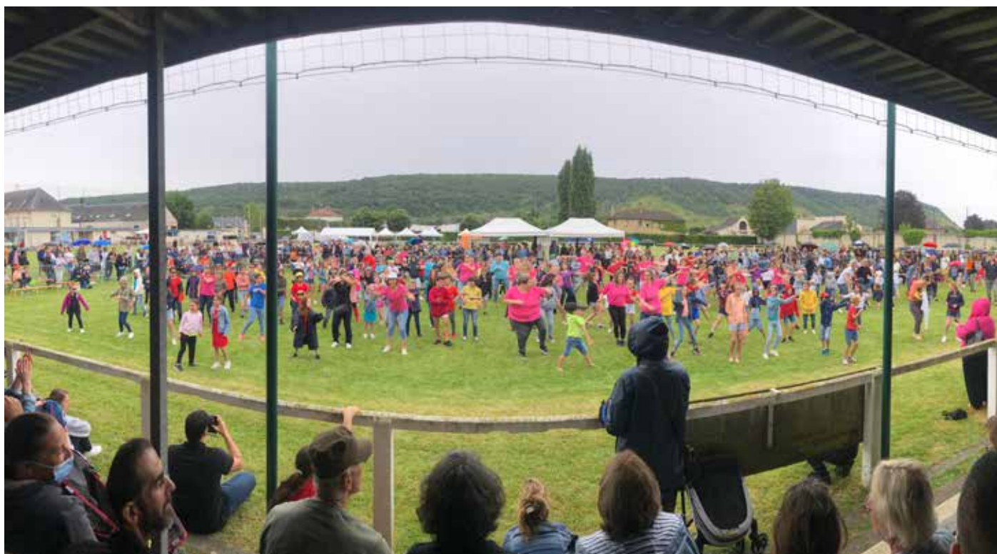
Kermesse des écoles

Le jumelage Romilly-Biebesheim a été créé le 2 juillet 1971.