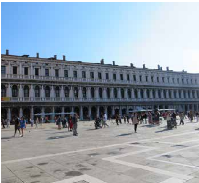
Voyage à Venise