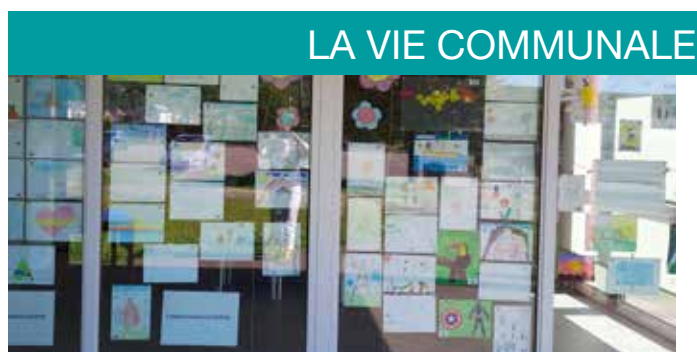
Le grand accrochage

Vous avez été nombreux à participer. Ce ne sont pas moins de 80 participants qui ont ainsi permis de mettre de la couleur à nos fenêtres.