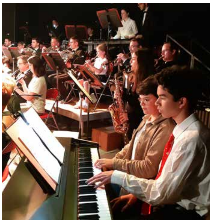
Concert avec l'orchestre d'Elbeuf

Après quelques semaines d'entraînement, les élèves des classes d'éveil ont chanté dans le conte musical des 3 Petits Cochons accompagnés par la classe de flûte à bec. Ce fut également un moment très émouvant et pour certains la première expérience de spectacle sur scène.