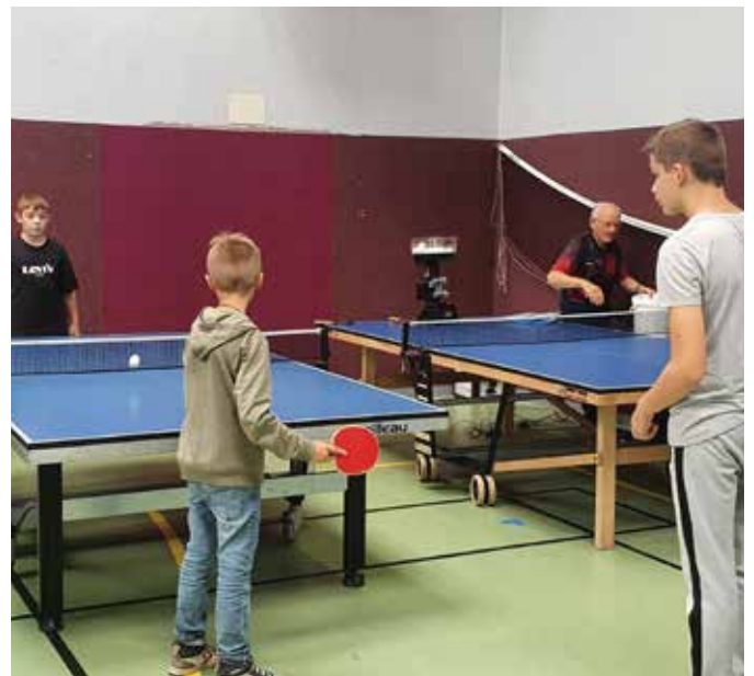
Fête du sport : les jeunes de la section Tennis de Table

Le samedi 10 septembre, à la Fête du sport, RAS tenait un stand et des joueurs de Tennis de Table ont été présents tout l'après-midi.