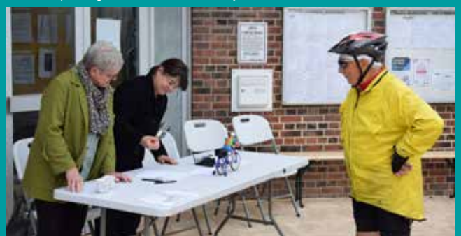
Stand de pointage à la mairie de Romilly