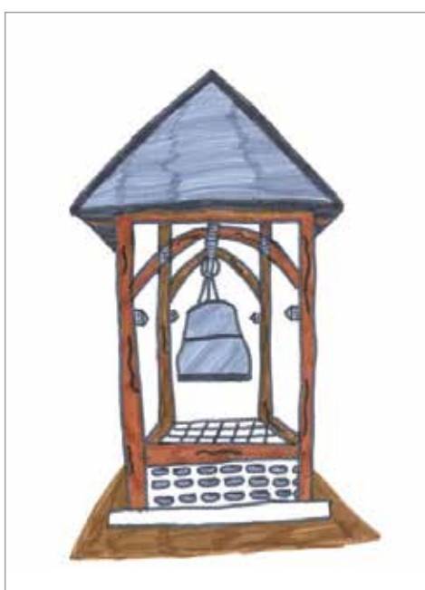
Eliott BRIDOUX - Le Carillon de la Bastille