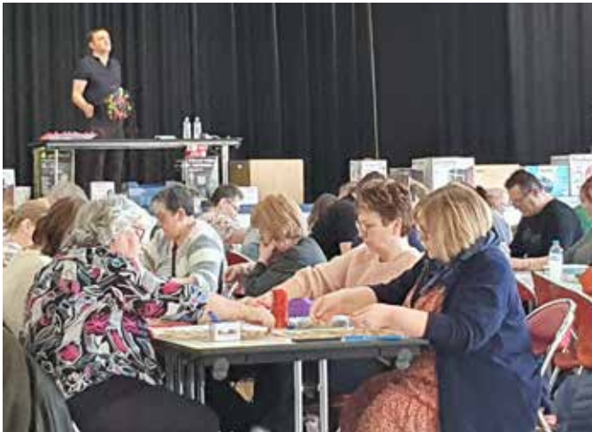
Complexe Louis ARAGON, loto des 19 et 20 mars 2022

Le loto annuel de RAS s'est tenu les 19 et 20 mars 2022, animé par Loto Passion.