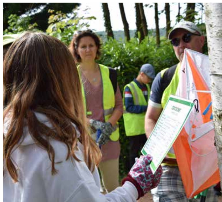
Opération nettoyage de la nature