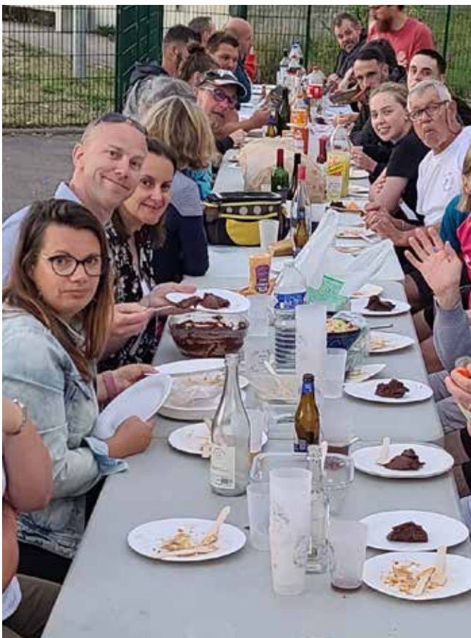
Badminton, repas de fin d'année