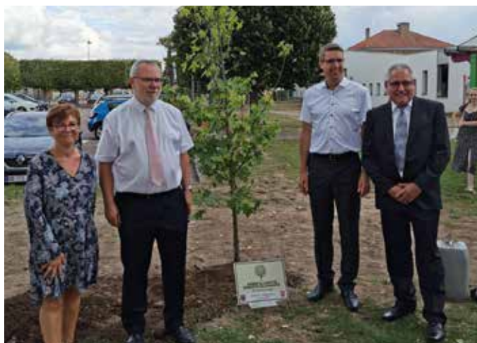
Plantation de l'arbre de l'amitié

Les cinq premiers mobiliers fleuris sont : le Lavoir restauré, le vélo Jacques Anquetil, le Carillon de la Bastille, le Mobilier des deux Amants et le Square Napoléon/Bonaparte.