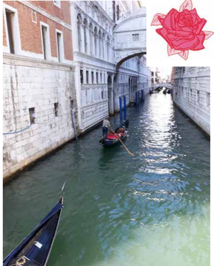
Les gondoles à Venise

En Octobre, un spectacle de transformistes nous a conduits près du Neubourg, au cabaret Vitotel. En Novembre le spectacle "Les Bodin's" au Zénith a ravi tout le monde, et la fin Novembre nous a réunis pour une démonstration des produits Proconfort, sans obligation d'achat, mais qui nous permet de profiter d'un repas gratuit et d'un petit loto interne.