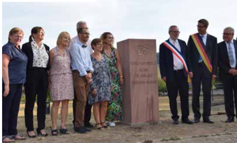
Stèle offerte par Biebesheim

Durant toutes ces années de rencontres, les familles ont bâti ensemble une unité fraternelle et sincère que nous devons coûte que coûte mettre à l'honneur, surtout après ces longs mois de pandémie. Nous avons décidé de faire deux échanges l'année de nos cinquante ans, et bien ce fut une excellente idée !