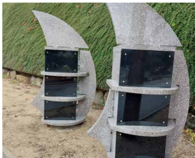
Cimetière - les columbarium