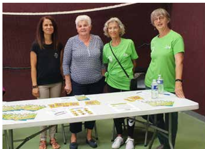
Fête du sport : le stand de RAS

Le mardi 4 janvier 2022, nous avons organisé notre soirée des vœux aux adhérents, autour d'un verre de cidre et le partage de la galette.