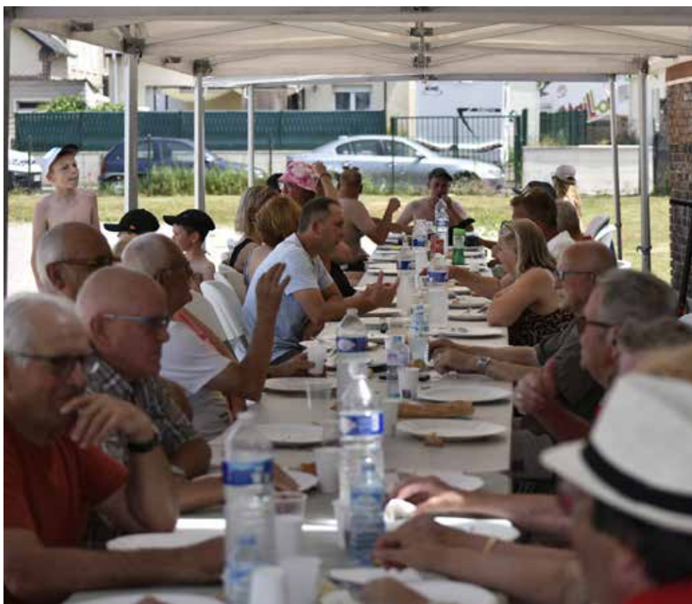
Tablée de l'association