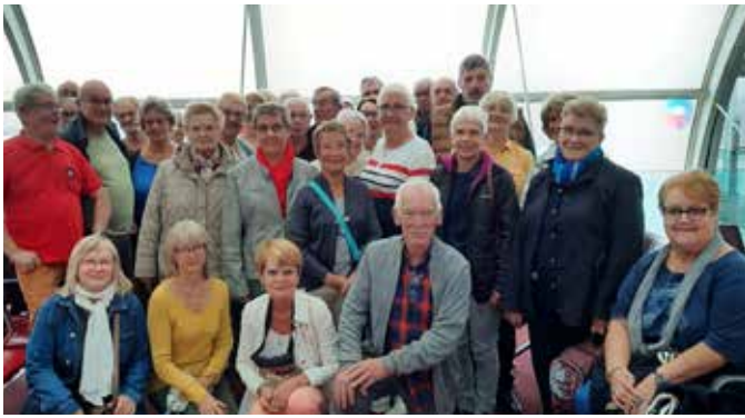
Voyage à Venise

L'année 2022 a repris avec notre Assemblée générale devant un grand nombre d'adhérents comme tous les ans, le bureau a été reconduit à l'unanimité.