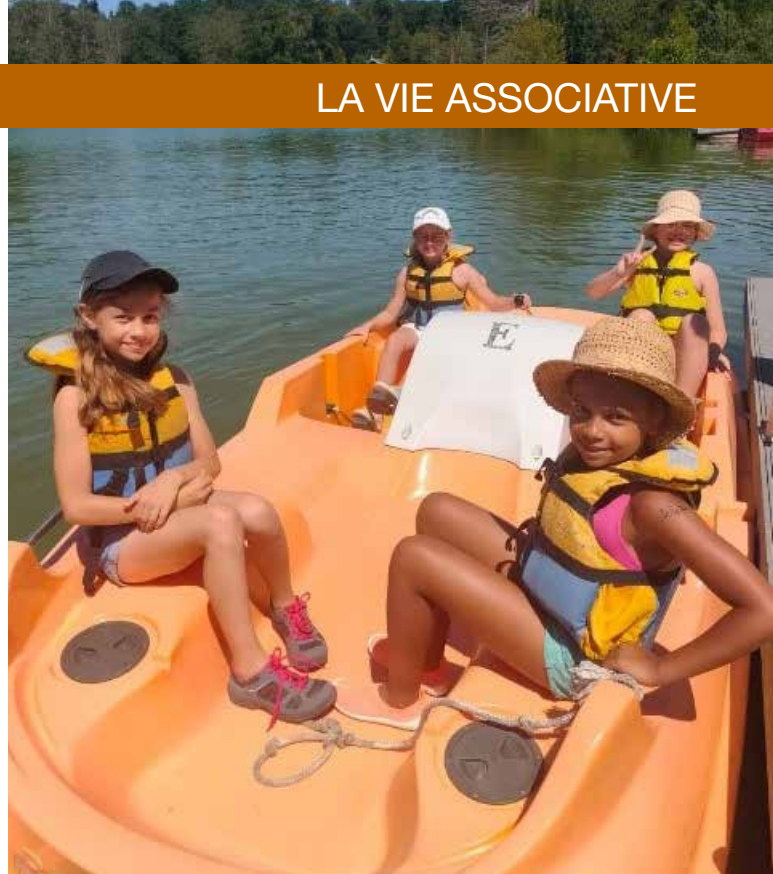
Sortie au parc Saint-Paul