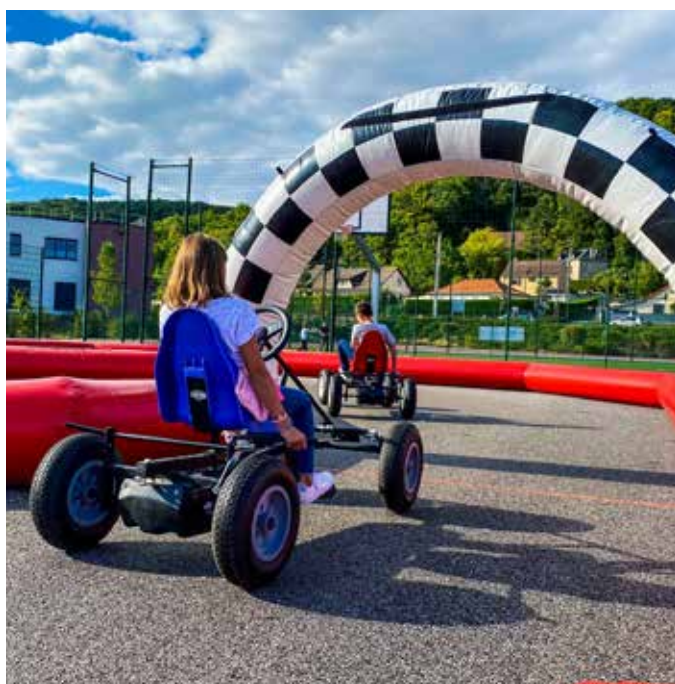
Fête du Sport