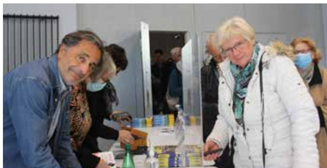
Dédicace de Nicolas Vanier

Nous souhaitons remercier nos partenaires institutionnels, artisans et commerçants ainsi que les PME et PMI du territoire qui, encore une fois, nous ont fait confiance.