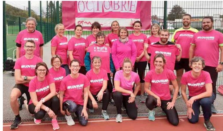
En soutien à Octobre Rose les adhérents de la séance Athlé-Fit ont joué le jeu