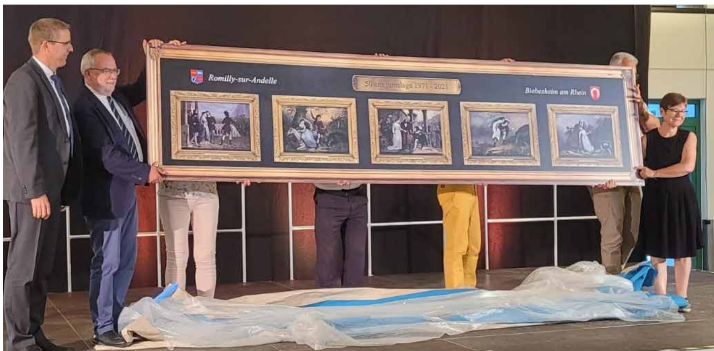
La légende des Deux Amants offerte par la mairie de Romilly sur Andelle à Biebesheim

Durant nos rencontres de juillet et août derniers, j'ai pu mesurer la force des liens qui nous unissent, en échangeant avec les familles durant ces deux séjours. J'ai rencontré des gens heureux de se revoir, heureux de pouvoir à nouveau rire ensemble, partager, tout simplement. Ces amis que nous avons au-delà de nos frontières sont des familles à part entière, ils tiennent dans nos cœurs une place importante.