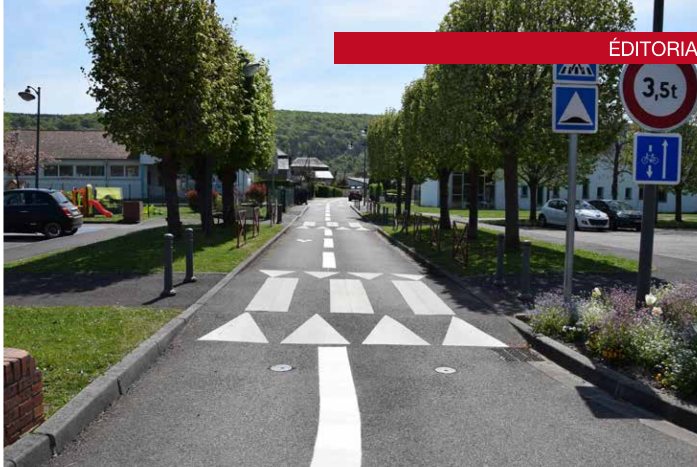
Piste cyclable Sente des Jardins du Couchant

Nos services techniques ont refait à neuf les toilettes du Complexe Louis ARAGON . Ils ont posé du carrelage et refait les peintures.