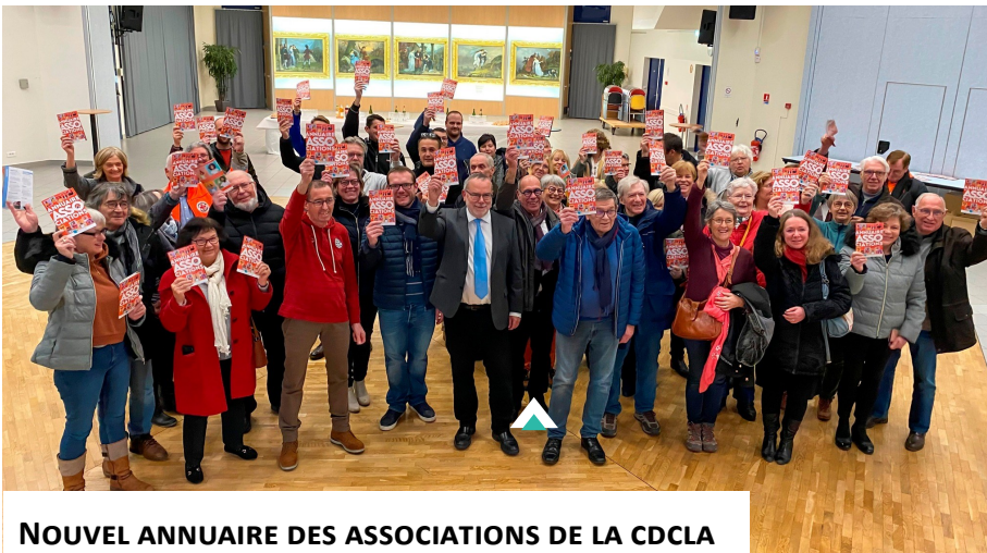
NOUVEL ANNUAIRE DES ASSOCIATIONS DE LA CDCLA