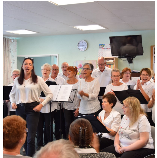
AGRANDISSEMENT DE LA POTIÈRE