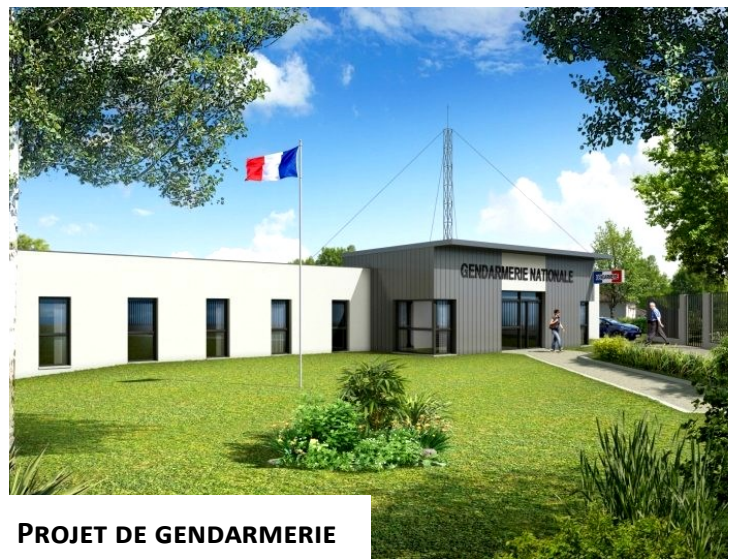
PROJET DE GENDARMERIE