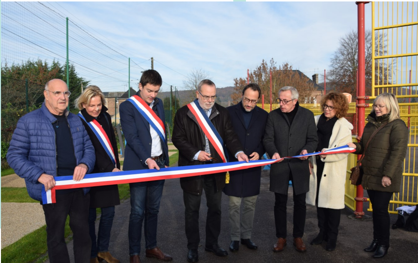
INAUGURATION DE L'ESPACE DE DÉTENTE INTERGÉNÉRATIONNEL