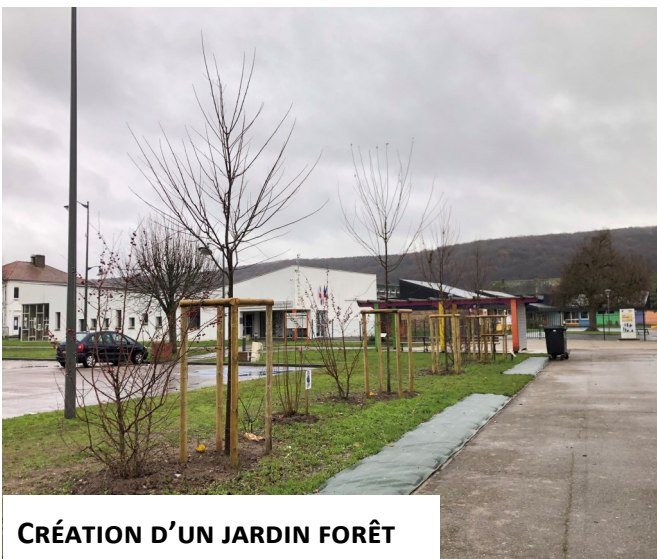
CRÉATION D'UN JARDIN FORÊT