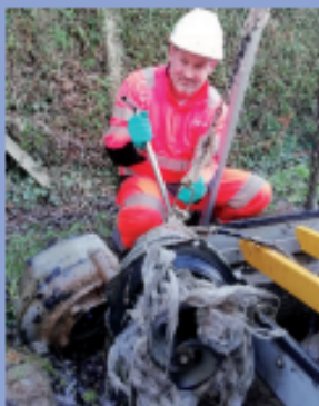
Exemple d'une pompe obstruée par les lingettes sur le territoire de l'Eure