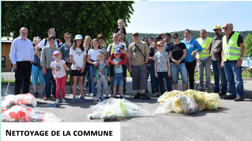
NETTOYAGE DE LA COMMUNE