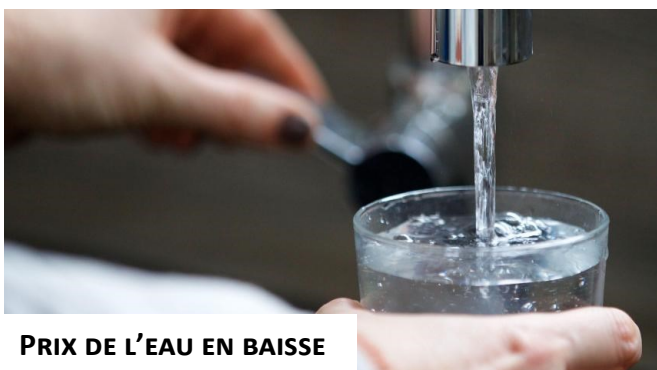
PRIX DE L'EAU EN BAISSÉ