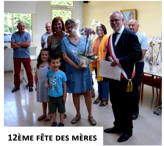
12ÈME FÊTE DES MÈRES