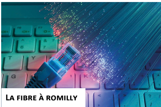
LA FIBRE À ROMILLY