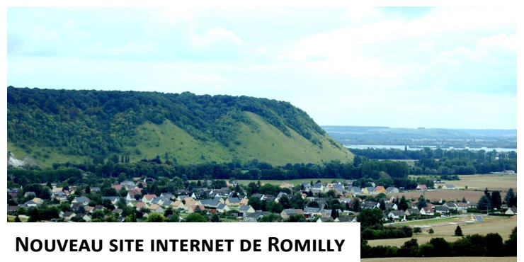
NOUVEAU SITE INTERNET DE ROMILLY