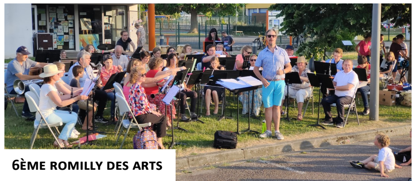
6ÈME ROMILLY DES ARTS