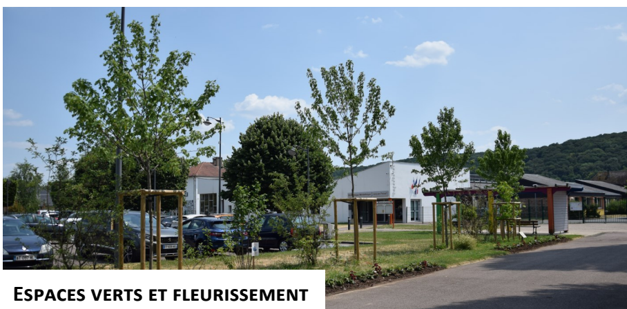
ESPACES VERTS ET FLEURISSEMENT