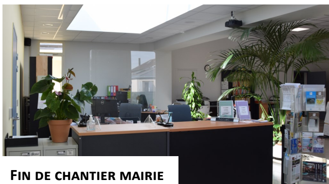
FIN DE CHANTIER MAIRIE