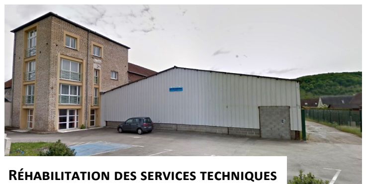
RÉHABILITATION DES SERVICES TECHNIQUES