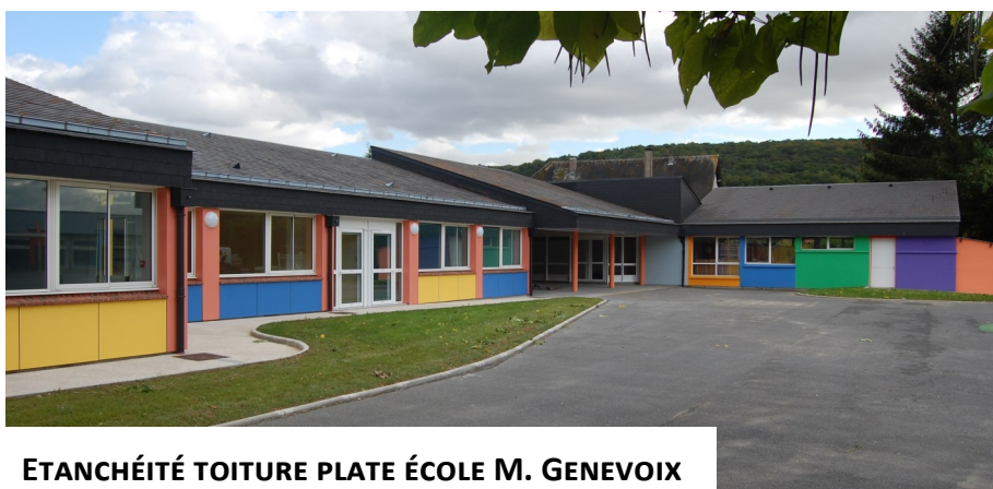
ÉTANCHÉITÉ TOITURE PLATE ÉCOLE M. GENEVOIX