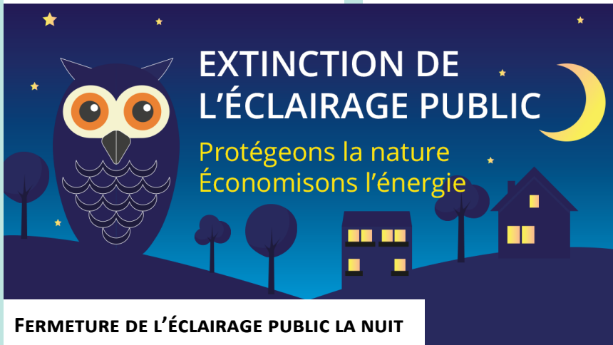
FERMETURE DE L'ÉCLAIRAGE PUBLIC LA NUIT