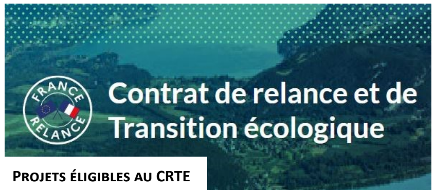
PROJETS ÉLIGIBLES AU CRTE