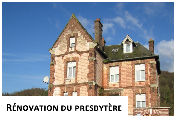
RÉNOVATION DU PRESBYTÈRE