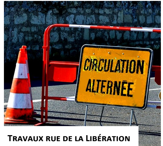
TRAVAUX RUE DE LA LIBÉRATION