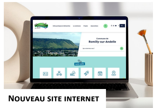
NOUVEAU SITE INTERNET