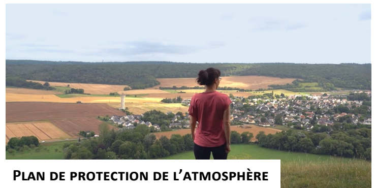
PLAN DE PROTECTION DE L'ATMOSPHÈRE