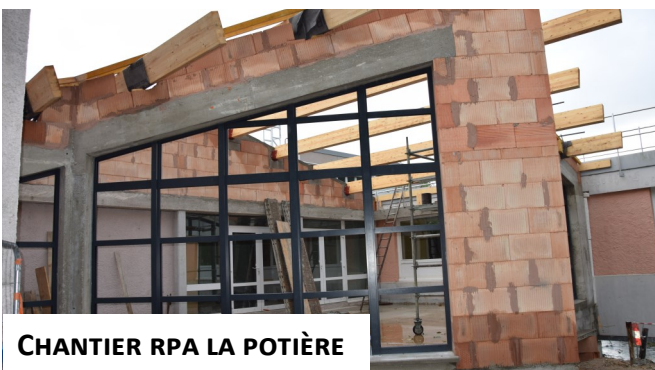
CHANTIER RPA LA POTIÈRE