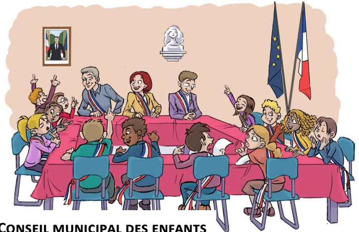
CONSEIL MUNICIPAL DES ENFANTS