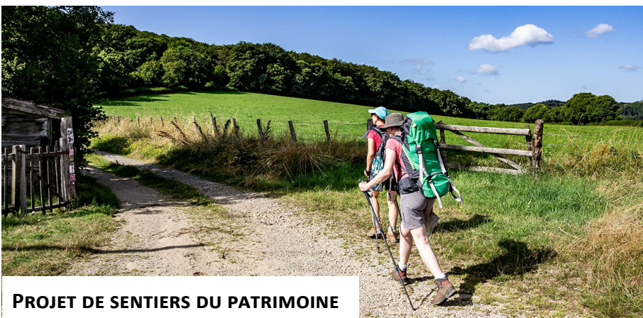
PROJET DE SENTIERS DU PATRIMOINE