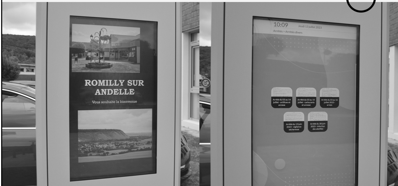
Borne numérique d'affichage légal située sur le parvis de la Mairie