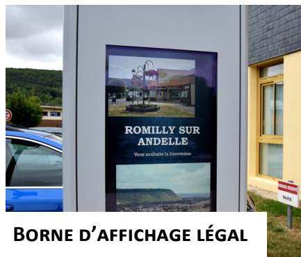
BORNE D'AFFICHAGE LÉGAL