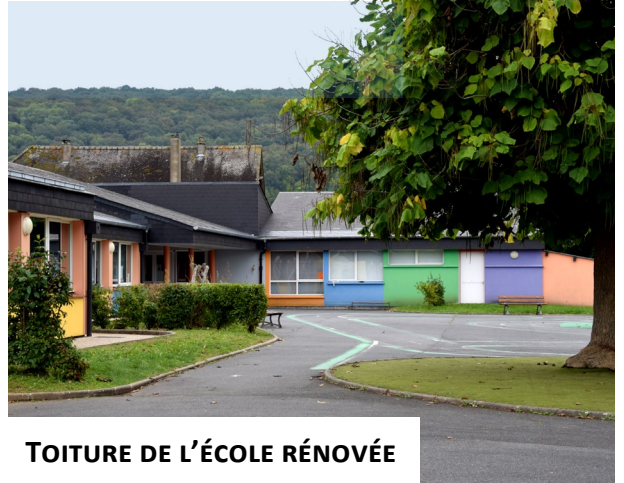
TOITURE DE L'ÉCOLE RÉNOVÉE