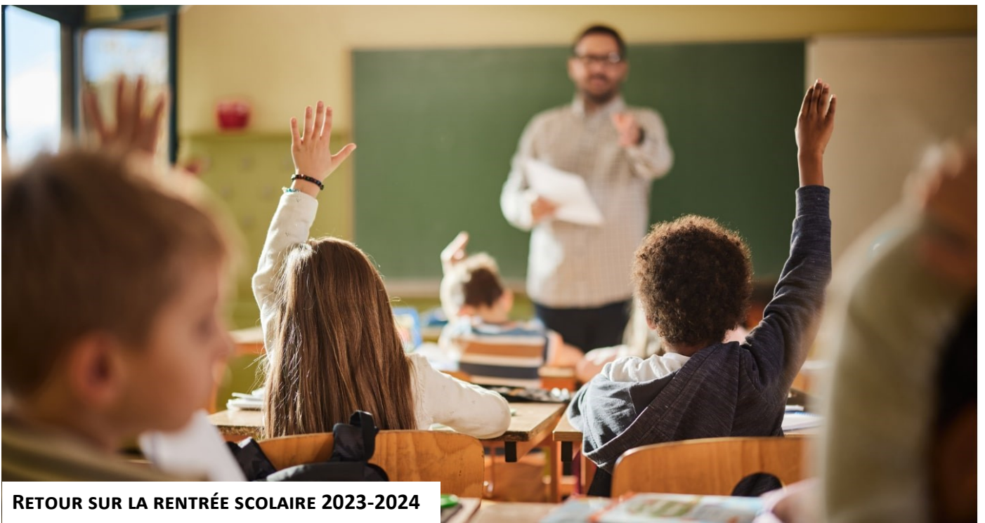
RETOUR SUR LA RENTRÉE SCOLAIRE 2023-2024