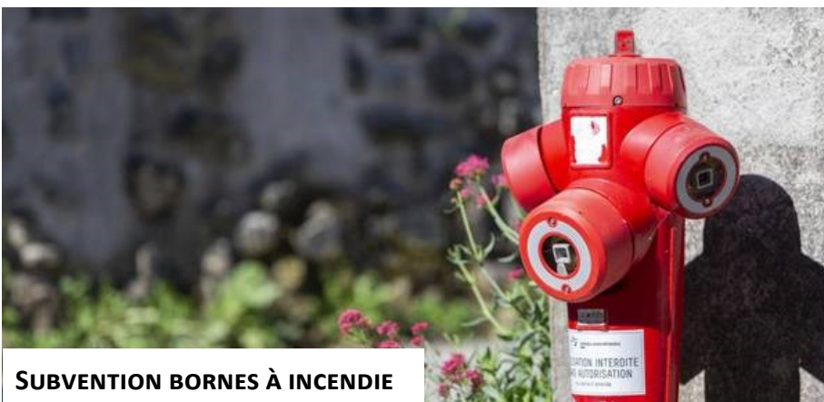
SUBVENTION BORNES À INCENDIE