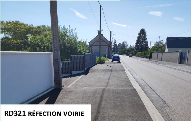
RD321 RÉFECTION VOIRIE