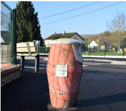
17 NOUVELLES BORNES