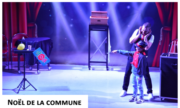
NOËL DE LA COMMUNE