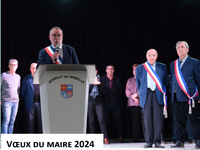
VŒUX DU MAIRE 2024