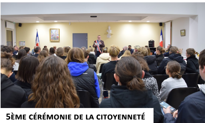
5ÈME CÉRÉMONIE DE LA CITOYENNETÉ