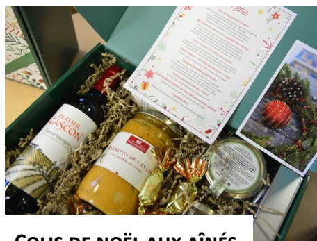
COLIS DE NOËL AUX AÎNÉS