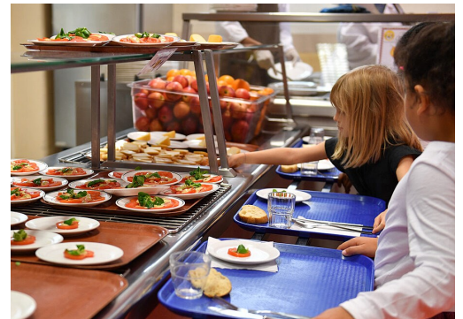
RECONDUCTION CANTINE À 1€