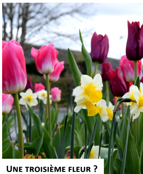
UNE TROISIÈME FLEUR ?