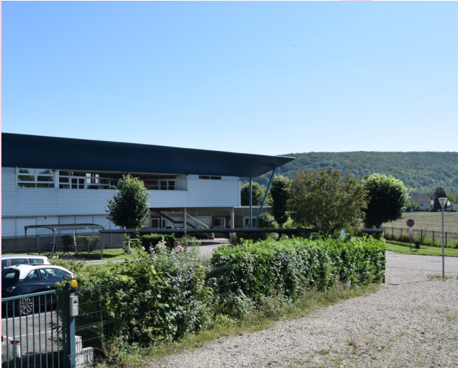
BILAN DE LA RENTRÉE SCOLAIRE