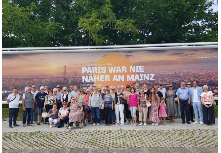
JUMELAGE BIEBESHEIM : 53ÈME ANNIVERSAIRE