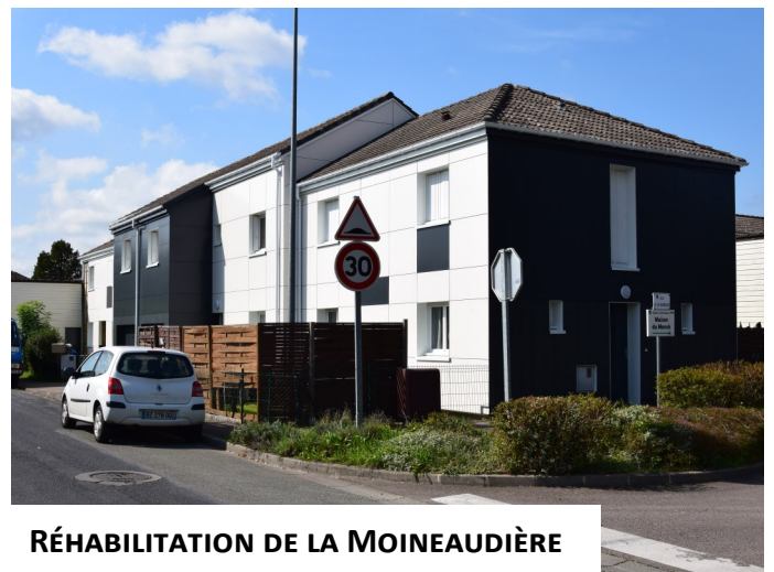
RÉHABILITATION DE LA MOINEAUDIÈRE