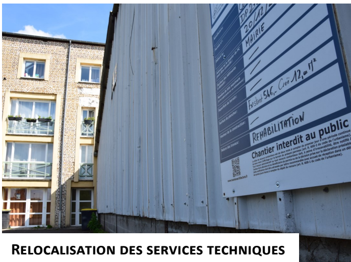
RELOCALISATION DES SERVICES TECHNIQUES