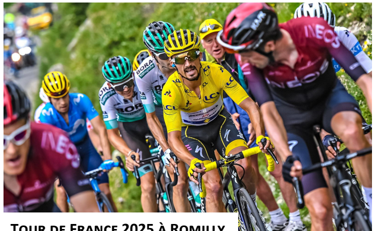
TOUR DE FRANCE 2025 À ROMILLY