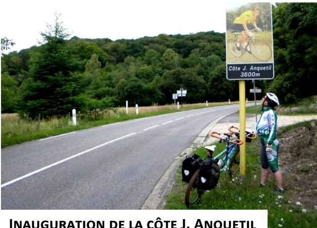
INAUGURATION DE LA CÔTE J. ANQUETIL