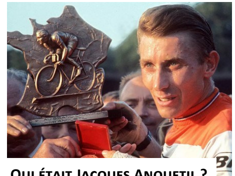
QUI ÉTAIT JACQUES ANQUETIL ?