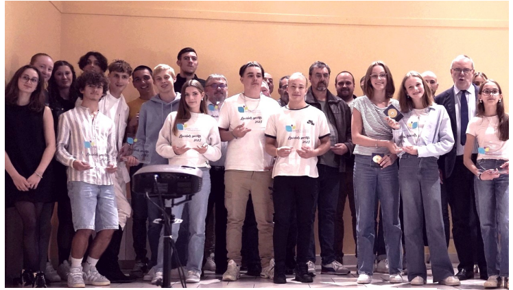
15ÈME ÉDITION DES LAURÉATS SPORTIFS CDCLA