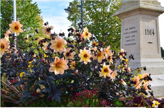
ROMILLY OBTIENT UNE TROISIÈME FLEUR !