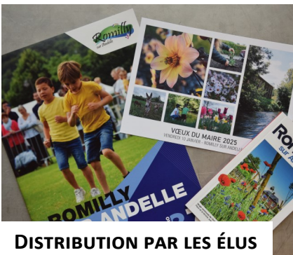
DISTRIBUTION PAR LES ÉLUS