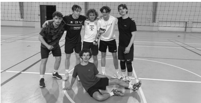
Equipe gagnante du tournoi de volley-ball de Pâques