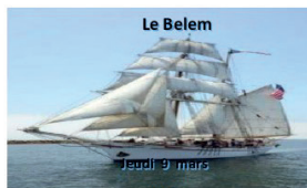
Jeu, 9 mars REPAS