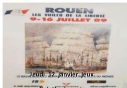
Jeu, 12 janvier, jeux, du monde Galette des rois