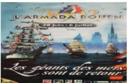
Jeu, 11 mai