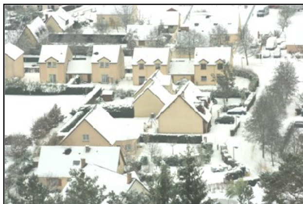
St Nicolas - zone U du P.L.U. - zone bleue du P.P.R.I.

Le délai d'instruction est de 2 mois pour le premier, 1 mois pour la deuxième. Les dispositions du P.L.U. applicables sont recherchées, l'avis de certains organismes est sollicité (syndicat du bassin de l'Andelle, ...). Si des pièces du dossier sont manquantes ou incomplètes, le délai d'instruction est prolongé.