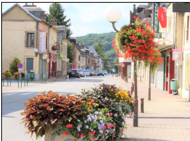
Dans la zone U du P.L.U. Le centre de Pont-Saint-Pierre

Le dossier complet est à votre disposition à la mairie (version papier ou version informatique) ou sur le site internet : www.pont-saint-pierre.fr rubrique « la commune » dans « urbanisme ».