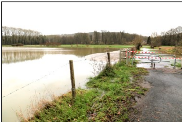
janvier 2018 - les Pâtures - zone verte du P.P.R.I.