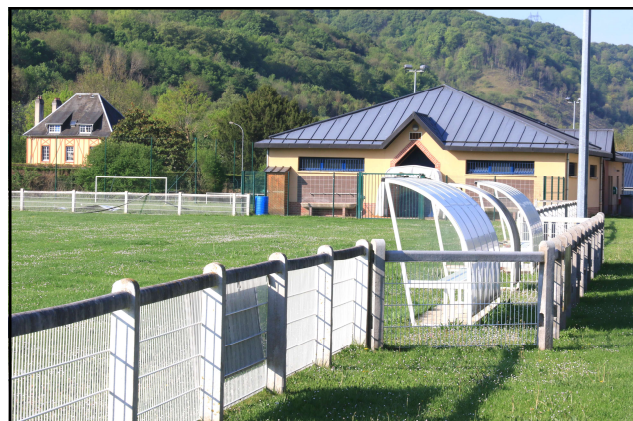
Le stade Gaston Philbert Le terrain des joueurs de la Nationale 3

*R.P.F.C. Romilly Pont-St-Pierre Football Club / *C.D.C.L.A. Communauté de Communes Lyons-Andelle *F.F.F. Fédération Française de Football