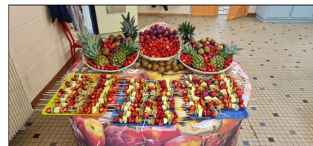
atelier fruits frais

En revanche, nous sommes vigilants sur la discipline, la politesse et le respect de l'autre !