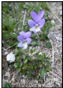
la violette de Rouen