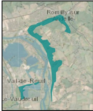
l'ensemble du site

Natura 2000 est un réseau de sites européens, définis sur un objectif commun de conservation de la biodiversité et de conciliation avec les activités humaines (1753 zones protégées en France).