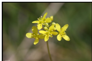
la biscutelle de Neustrie

Ce site, avec deux autres sites, « les terrasses alluviales de la Seine » et « les îles et berges de la Seine dans l'Eure », est administré par un comité de pilotage qui regroupe des représentants de l'Etat et ses établissements publics, des collectivités territoriales concernées, soit 29 communes et 4 communautés de communes notamment, le Conseil Départemental, le Conseil Régional, ...), des représentants des propriétaires, exploitants et utilisateurs des espaces et terrains inclus dans les sites.