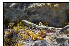
Le lézard des murailles