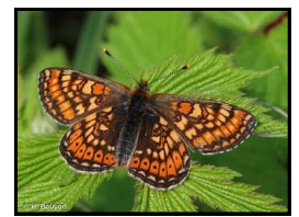
le damier de la succise