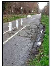
Quand des automobilistes ne respectent pas les chicanes

Des plots supplémentaires seront ajoutés pour renforcer la visibilité par tous de la présence des chicanes, éviter que les voitures passent derrière et aussi pour que les cyclistes ne circulent plus derrière les alignements, surtout quand une voiture arrive au même moment : ce n'est finalement pas vraiment un facteur de sécurité, contrairement à l'objectif initial. Deux chicanes seront déplacées, pour réduire la longueur qui permet d'accélérer entre deux aménagements.