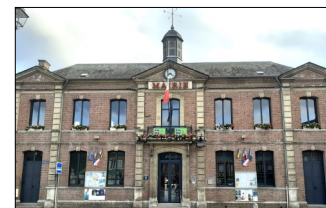
la mairie après

La mairie fait peau neuve. Après un important réaménagement intérieur avec la création de l'Agence Postale Communale en 2022, ce sont les fenêtres et portes qui viennent d'être changées. Pas du luxe, me direz-vous, car les précédentes dataient de plus d'une centaine d'années, selon les témoignages et d'anciennes photos.