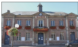
la mairie avant

La mairie fait peau neuve. Après un important réaménagement intérieur avec la création de l'Agence Postale Communale en 2022, ce sont les fenêtres et portes qui viennent d'être changées. Pas du luxe, me direz-vous, car les précédentes dataient de plus d'une centaine d'années, selon les témoignages et d'anciennes photos.