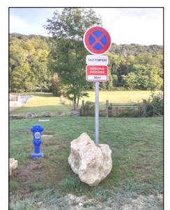
à l'entrée des Bouleaux

D'autres implantations sont à l'étude pour compléter notre défense incendie.