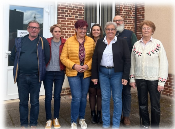
Les infos Pirisiennes réalisées par la commission communication

Imprimé par nos soins ne pas jeter sur la voie Publique