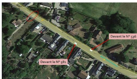
Pose chicanes provisoires