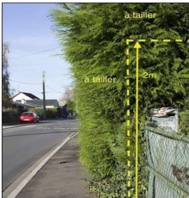
RESPECT DE L'ESPACE PUBLIC

Il n'est permis d'avoir des arbres en bordure des voies communales qu'à une distance de 2 mètres pour les plantations qui dépassent 2 mètres de hauteur et à la distance de 0,50 mètre pour les autres. Cette distance est calculée à partir de la limite de la voie publique, toutes dépendances comprises