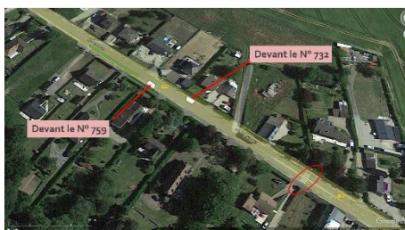
Pose chicanes provisoires