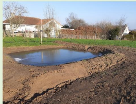
Sur l'aire de loisirs Mare du pressoir