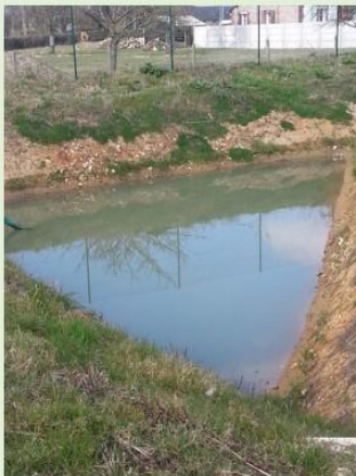
Mare Autheuil (Réserve incendie)