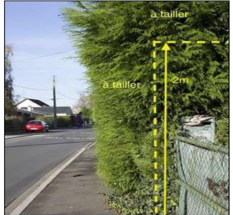
RESPECT DE L'ESPACE PUBLIC

L'article R. 116-2 5° du Code de la voirie routière dispose que : « seront punis d'amende prévue pour les contraventions de la cinquième classe »