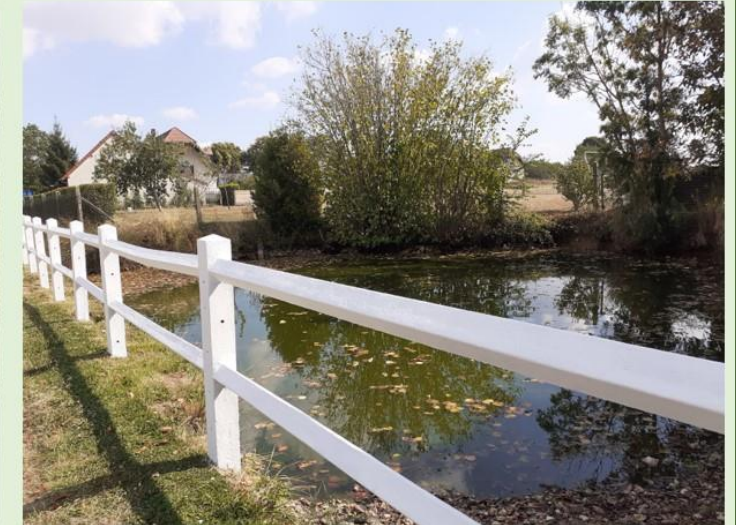
Mare de la ferme