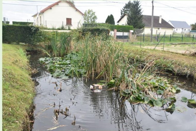
Mare du boulodrome