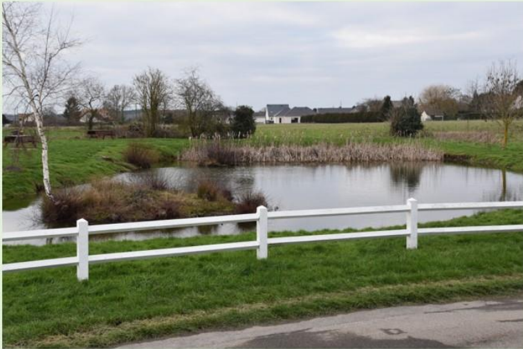
Mare du Pavillon